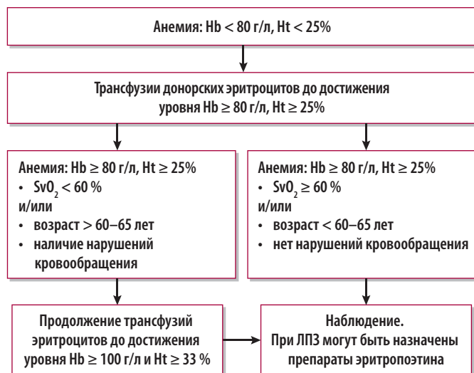
Рис. 2. Алгоритм коррекции хронической анемии у больных с опухолями кроветворной и лимфоидной тканей ЛПЗ — лимфопролиферативные заболевания.