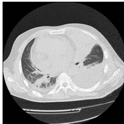
Рис. 2. Больной Б. Фрагмент компьютерной томографии от 07.09.12 г. Значительное распространение зоны консолидации легочной ткани в язычковых сегментах левого легкого. Увеличение количества жидкости в плевральных полостях, больше слева. Появление новых участков уплотнения легочной ткани в нижней доле правого легкого

был проведен первый консолидирующий курс химиотерапии по схеме Idac-Mito [24]. После окончания курса химиотерапии на фоне трехростковой цитопении (анемия, тромбоцитопения, агранулоцитоз) у больного развились тяжелые инфекционные осложнения: сепсис, вызванный P. aeruginosa (положительная гемокультура от 15.07.2012 г.), мукозит ( P. aeruginosa ), энтероколит, двусторонняя пневмония (рис. 1).